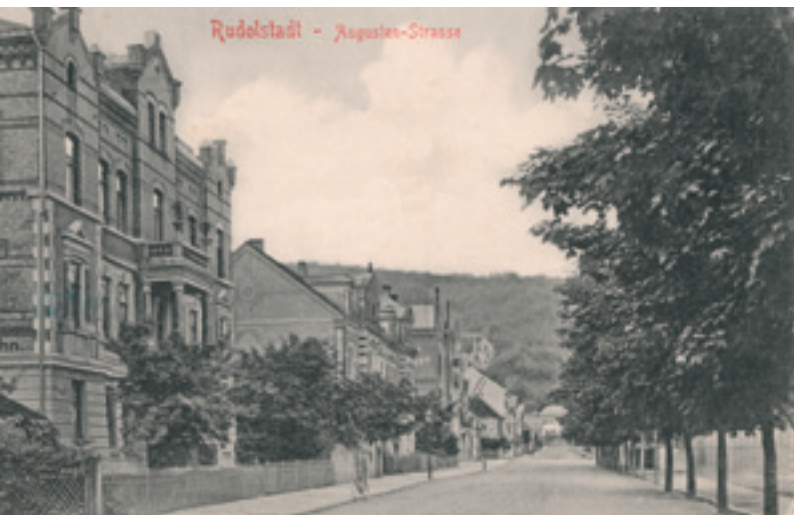
Villen in der August-Bebel-Straße, früher Augustenstraße