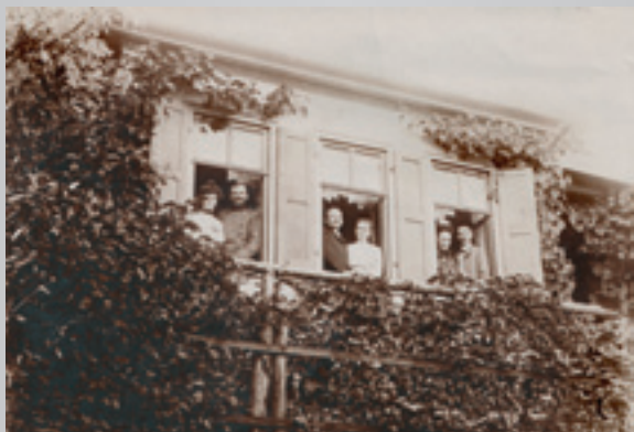
Rudolstädter Berghäuschen und ihre Bewohner

oder Richard Wagner. Die wesentliche Erweiterung der Bibliothek und der Gemäldesammlung aus dem 16. Jahrhundert, die Gründung des Theaters 1792/93, die Erhebung der Schule zum Gymnasium, die Entstehung des Naturalienkabinetts sind im 18. Jahrhundert einige Indikatoren für die kulturelle Blüte der Stadt.