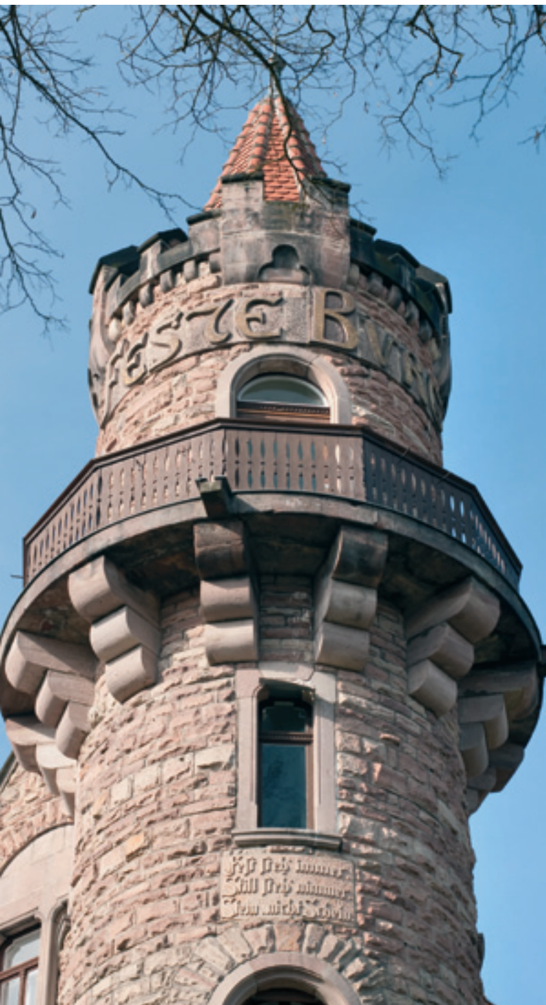
Der Turm der festen Burg

für den VEB Thüringisches Kunstfaserwerk »Wilhelm Pieck« und öffnete am 1. September 1962 ihre Pforten für 70 Kinder und ihre 17 Erzieherinnen.