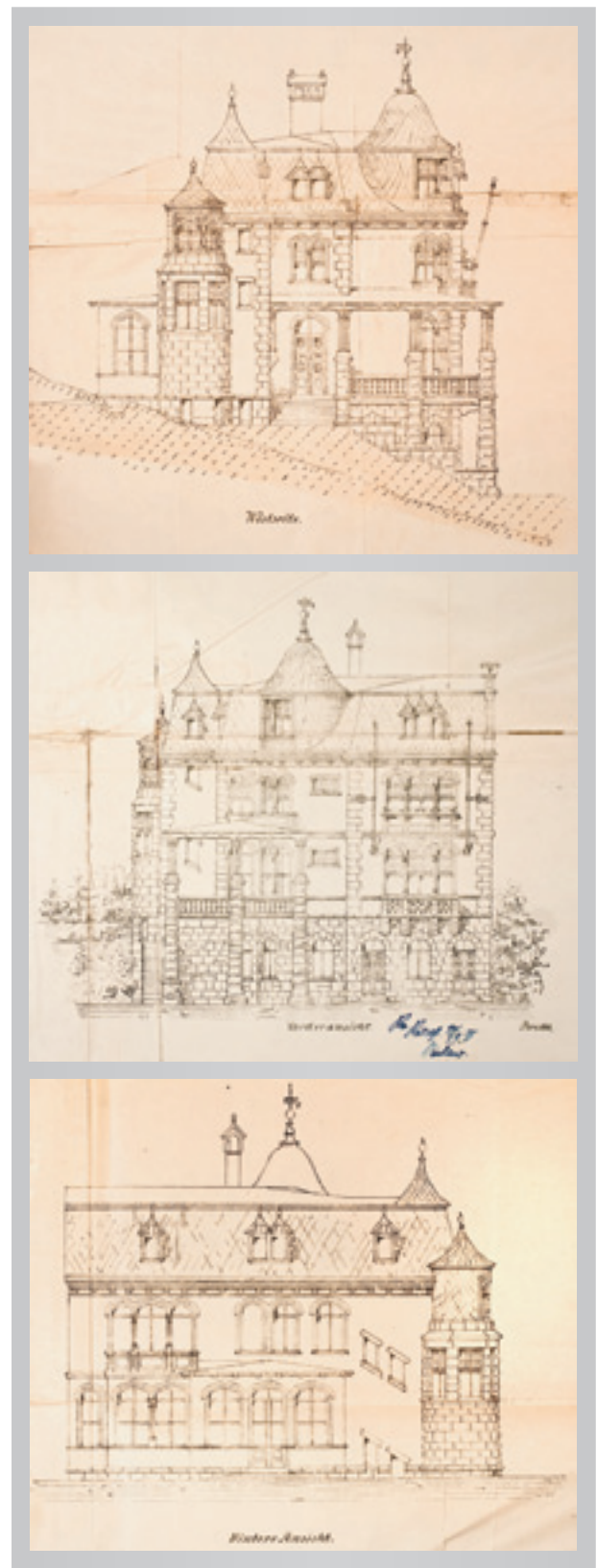
Bauzeichnungen des Architekten Rudolf Brecht, 1898

malerisch vor Augen zu führen. Eine Konstruktionsweise geht aus den Zeichnungen keineswegs hervor, auch entsprechen dieselben durchaus nicht den Vorschriften der §§14 und 15 der Bauordnung. Ferner muß darauf hingewiesen werden, daß wohl fast durchaus das Mauerwerk sowohl am Gebäude selbst,