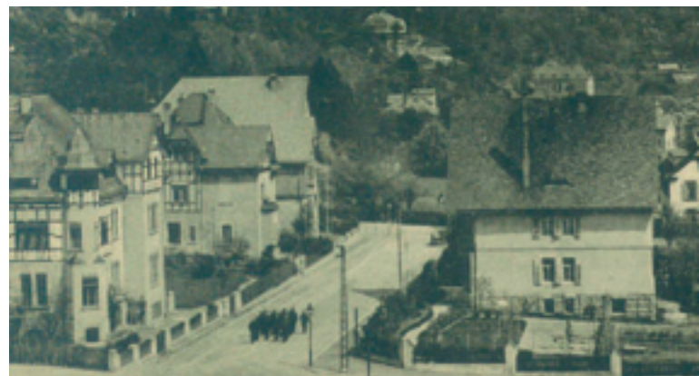
Villen in der Lutherstraße

Die Ausgestaltung mit Vertäfelungen, Stuck, Parketten und bunten Glasfenstern hing natürlich vom Vermögen ab, wurde