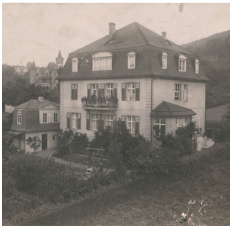
Die Villa mit Nebengebäude, im Hintergrund die Feste Burg

gebracht hatte. Außerdem fanden sich auf dem Speicher noch zwei historische Panoramaphotographien der Niagarafälle und von Montreal. Eine Photographie hängt heute in der Diele des Hauses und erinnert an den weiten Lebenswurf, der von Taubenbach in die Welt und doch wieder nach Thüringen, nach Rudolstadt führte.