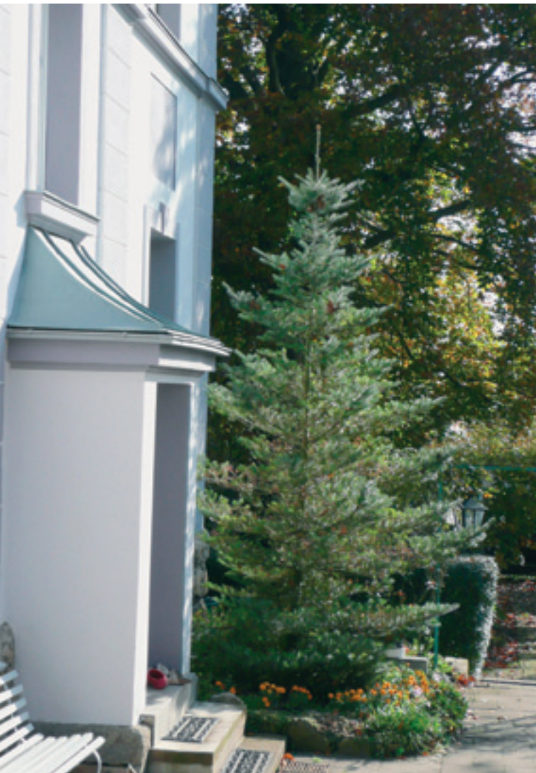
Der Dienstboteneingang mit direkter Verbindung zum Nutzgarten

Die Gartenräume sind durch Hecken, Wege und Stufen getrennt und verbunden. Es gibt einen befestigten Weg, der vom Eingang rechts und links um das Haus führt. Dabei kommt man auf der Westseite zum Lieferanteneingang und Nutzgarten, während man auf der Ostseite durch einen kleinen Rosengarten zum Ausgang des Blumenzimmers kommt. Dem Planer gelang es sogar, in die geschwungenen Linien des Grundstücks entlang der beiden projektierten Straßen einen formalen Garten mit rechteckigen Beeten einzufügen. Formale Gartenteile, in denen Blumenbeete und Rabatten von zierlichen Hecken eingefasst sind, wurden südlich und östlich der Villa angeordnet. Wenn man aus den Fenstern der Repräsentationsräume blickte, sah man diese gestalteten Zierbeete. An der südseitigen Gartenfront führen rechts und links einige Stufen hinab zur nächsten, als Parterre gestalteten Gartenebene. Mit mehreren Treppen wird die Hanglage erschlossen. Als weiterer Blickfang diente das in der Südostecke über der Straße auf der Gartenmauer sitzende Gartenhaus. Es hat sehr kleine ovale Fenster, der Ausblick aus dem Häuschen war also nicht entscheidend. Es kündigte aber den von der Klinghammerstraße Heraufkommenden die anspruchsvolle Villa an, bevor sie diese sehen konnten. Dort