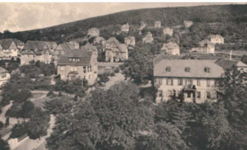
Villen in der Schloßstraße

Im Klassizismus galt noch die strenge Proportionenlehre der Römer mit ihren gleichmäßigen Reihungen der Fenster-